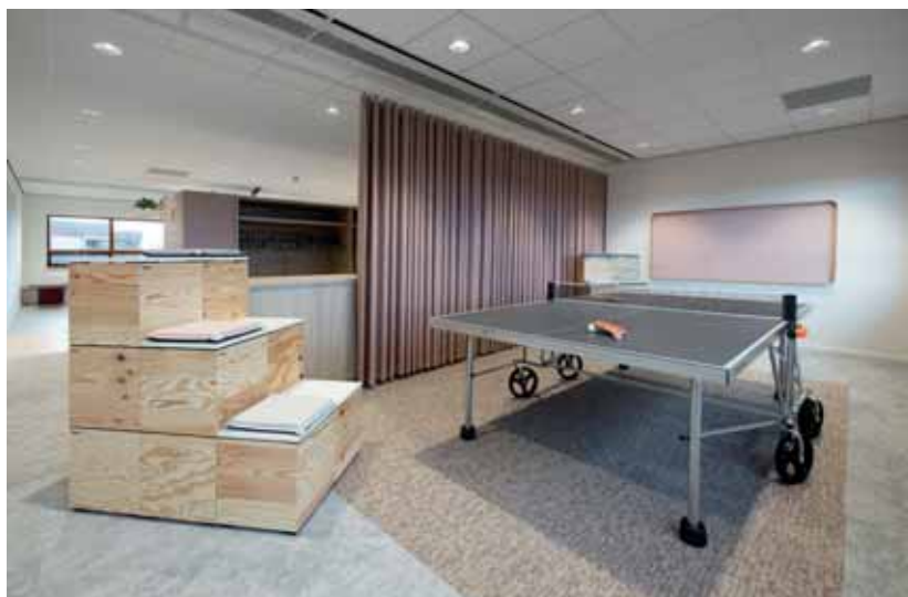
FOTO MIDDEN Op elke verdieping is ruimte voor ontspanning, zoals met deze tafeltennistafel.

FOTO BOVEN Overlegruimte met skippyballen.