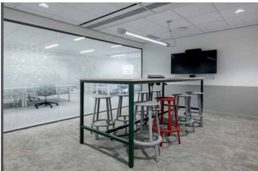
FOTO ONDER Op verschillende plekken zijn rode elementen te zien – zoals lampen, fauteuils, kleden en krukken – als symbool voor de patiënt.

FOTO BOVEN Huiskamer op een van de verdiepingen.