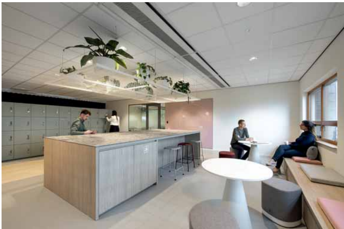
FOTO ONDER Lockers en uitgiftepunt op een van de verdiepingen, met aan het plafond een door Burobas ontworpen hangelement voor plantenbakken.