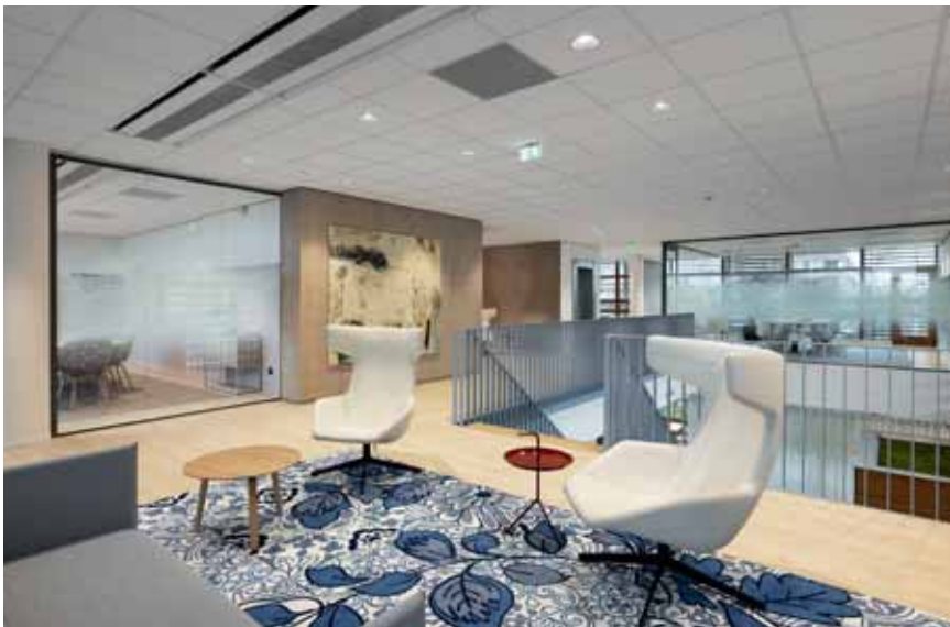
FOTO LINKS Het entreegebied, met de grote vide en uitnodigende trap naar de eerste verdieping.