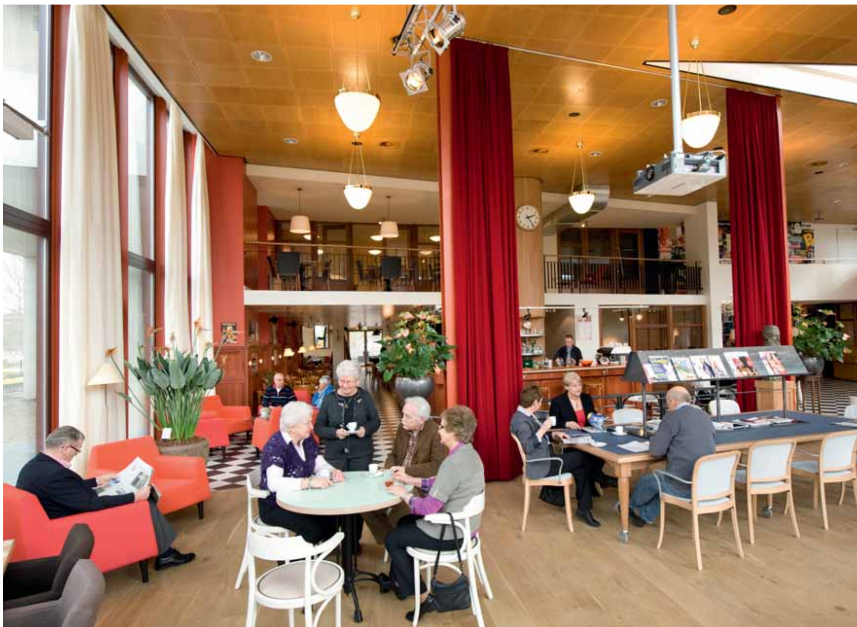
FOTO LINKS Het grand café